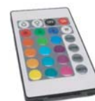
Control RGB Key remote